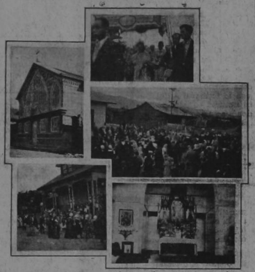
El acto resultó imponente y grandioso