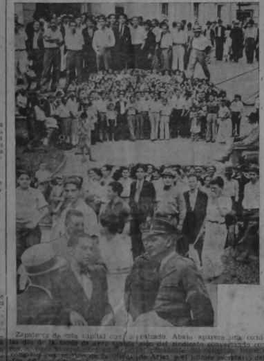
El departamento de emisión que el autorizó, sin intervención parlamentaria ni del ejecutivo, a emitir por el valor de la mitad de la meta de cada una de las series de billetes de cinco colones.

Se resuelve la dificultad que se planteaba en la junta, la secretaria de hacienda